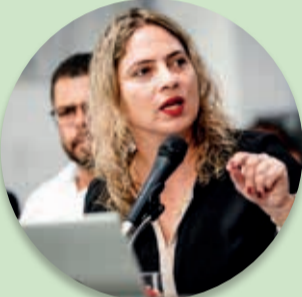
Deputada Estadual Beatriz Cerqueira

diretas de prevenção e combate aos incêndios, reflorestamento de áreas atingidas, recuperação de ecossistemas, reabilitação de animais e contratação de apoio operacional.