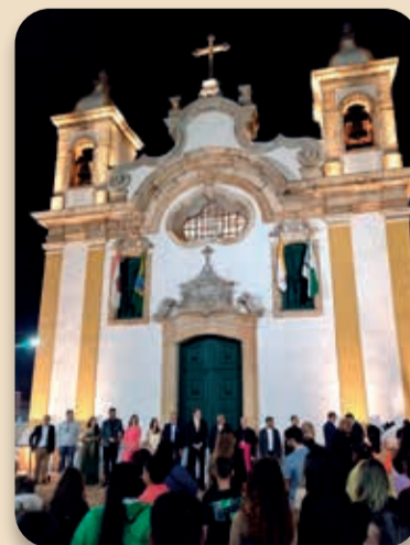
Autoridades e a comunidade participaram da reabertura da Matriz