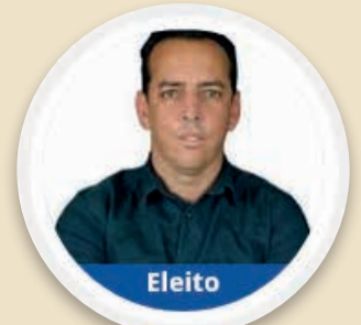
Vantuir (AVANTE) 1.705 votos