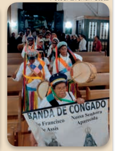
A Banda de Congado São Francisco de Assis e Nossa Senhora Aparecida participou do evento