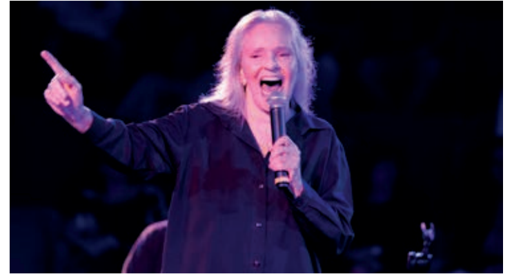
A cantora Angela Ro Ro se apresenta no sábado 19/10

desde 2023 percorre cidades mineiras passando por diversos estilos e expressões musicais, desde a música dos povos originários, cânticos sacros dos missionários jesuítas, até o chorinho, samba, frevo, funk e Hip Hop. Fonte: Assessoria Sons do Brasil