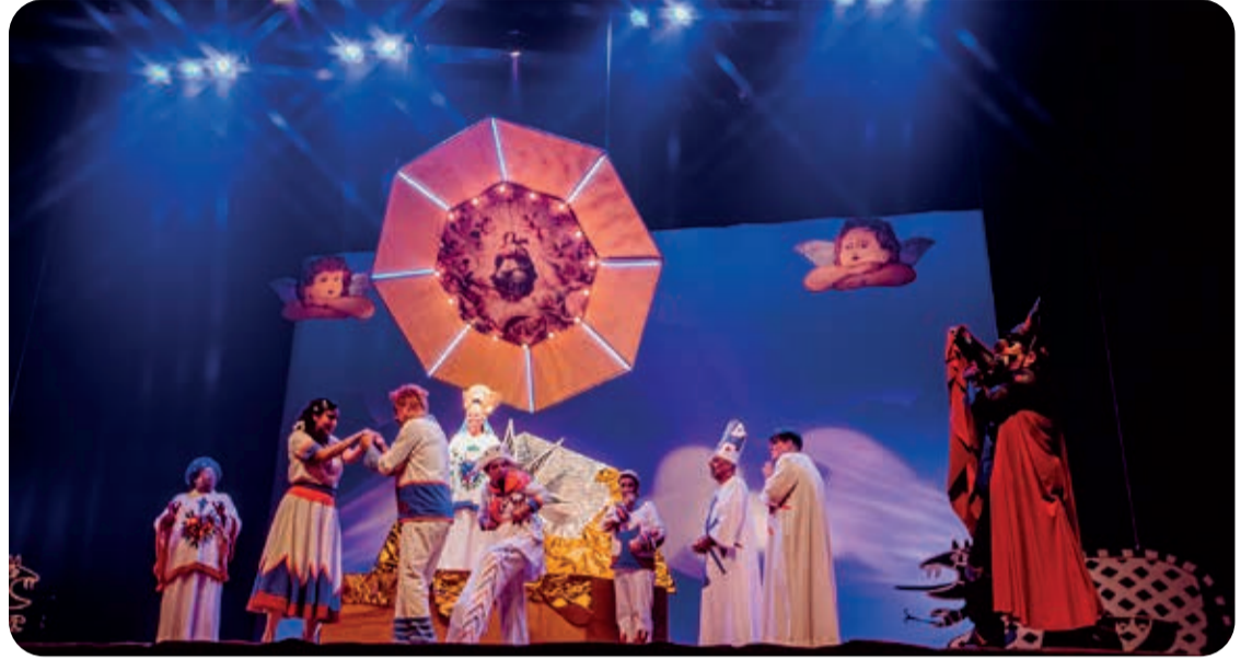
Ópera O Auto da Compadecida

“Auto da Compadecida, a Ópera” traz a comédia como elemento principal de sua linguagem. Para cumprir essa missão, formou-se um grande elenco em cena, e também nas gravações, para que essa relação direta com a plateia estabelecida nos