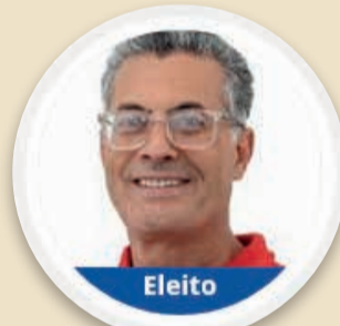
Kuruzu (PT) 1039 votos