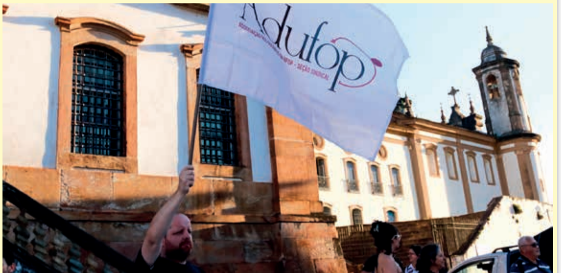
Manifestação na Praça Tiradentes em defesa das universidades, institutos e CEFETs em 10/05/24

Fundada em 4 de novembro de 1982, a Associação dos Docentes da Universidade Federal de Ouro Preto (ADUFOP), atua na defesa dos interesses, direitos e prerrogativas dos docentes da UFOP. Seção Sindical do Sindicato Nacional dos Docentes das Instituições de Ensino Superior (ANDES-SN), a ADUFOP congrega atualmente mais de 800 sindicalizados, entre docentes em atividade e aposentados, vindos dos diferentes campi da UFOP, em Mariana, Ouro Preto e João Monlevade.