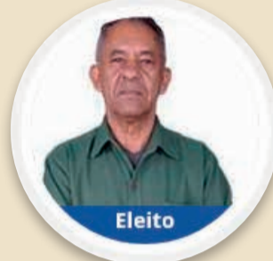
Ze do Binga (PV) 1304 votos