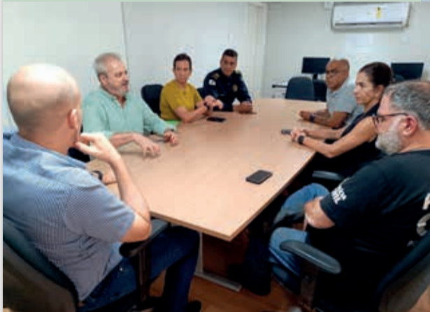
Reunião foi realizada na sede do Ministério Público de Mariana