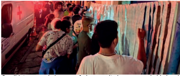
Candidatos e apoiadores conferiam resultados nas proximidades do cartório eleitoral no início da noite do domingo de eleições municipais 06/10

Votos em Branco totalizaram 2.034 que representou 4,00% do total. Já os nulos foram computados 3.170 representando 6,23%. Ao todo foram registrados 50.863 votos nas urnas no município de Ouro Preto. Anulados sub judice (em trâmite judicial)totalizaram 501.