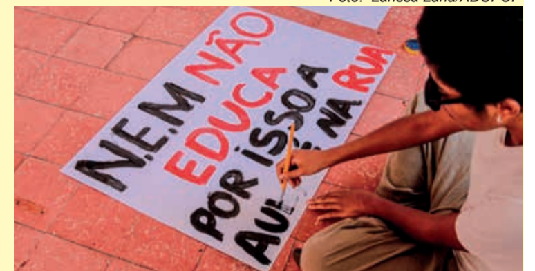
Durante a greve dos professores, realizada neste ano, uma das reivindicações era a Revogação do Novo Ensino Médio

Ainda, a reforma prevê que nas escolas públicas devem ser oferecidos pelo menos dois itinerários. Já na escola