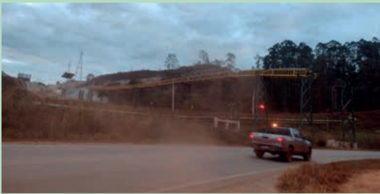
Trecho da estrada próximo a entrada da Samarco - foto de arquivo - início da obra

Durante a atividade, o tráfego próximo do KM 113, quase em frente à portaria da empresa do Complexo de Germano, será interrompido das 8h às 17h. O fluxo de carros será feito por um desvio de apenas 4 metros e nele haverá uma operação “pare e siga”.