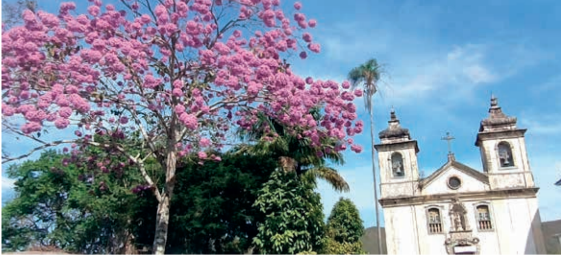
A Igreja foi fechada em 2014 e a comunidade reivindica a reabertura do templo

Ouro Preto - Começa hoje as obras de restauro da igreja de Bom Jesus do Matosinhos, às 9h30 será realizada uma bênção para o início dos trabalhos no adro da igreja. Em 2014 o edifício teve seu fechamento determinado pelo comprometimento da estrutura.