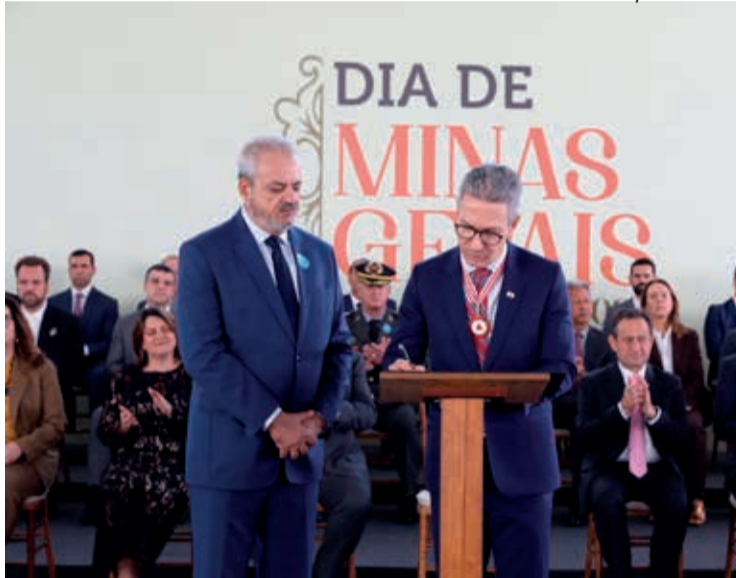
Prefeito Celso Cota e o governador Romeu Zema transferindo a capital do Estado para Mariana

O vice-governador, um dos homenageados deste ano, reafirmou que o Governo de Minas seguirá lutando pela reparação necessária e justa para Mariana e as demais cidades do Vale do Rio Doce.