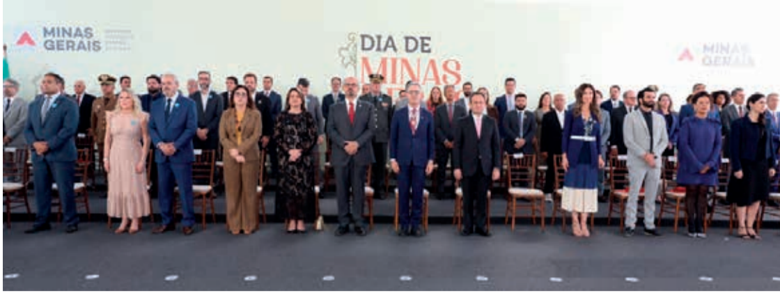
Solenidade foi realizada na Praça Minas Gerais em Mariana