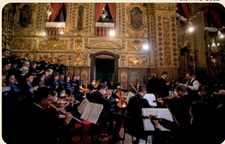
Concerto do Coral Cidade dos Profetas na Basílica do Pilar

O concerto em Ouro Preto faz parte do "Plano Anual Coral Cidade dos Profetas 2024",